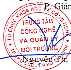
Nguyễn Thị Bích Thủy

- Kết quả chỉ có giá trị trên mẫu thử/tại thời điểm đo đạc nếu không có ghi chú khác. - Tên mẫu, tên khách hàng được ghi theo yêu cầu của nơi lấy mẫu/đo đạc/gửi mẫu. - Không được trích sao toàn bộ hoặc một phần phiếu kết quả này nếu không được sự đồng ý bằng văn bản của Trung Tâm ETM.